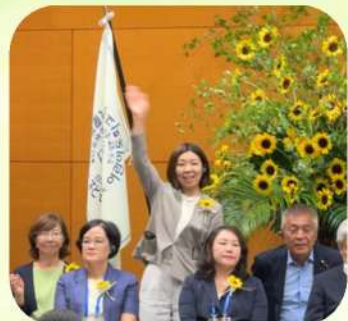
8/18 日中韓子ども童話交流事業 開会式