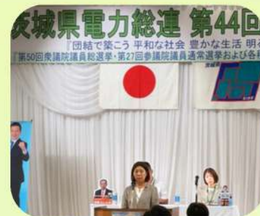
8/28 茨城県電力総連第44回定時大会