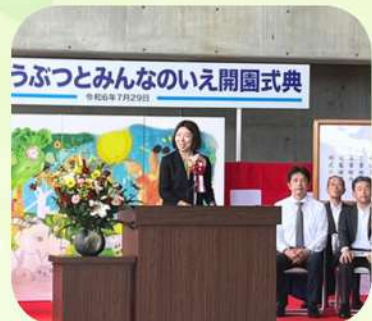
7/29 霞ヶ浦どうぶつとみんなのいえ開園式典