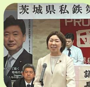
11/5 茨城県私鉄労連第70回定期大会