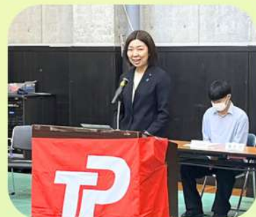
8/4 JP労組龍南支部第17回定期支部大会