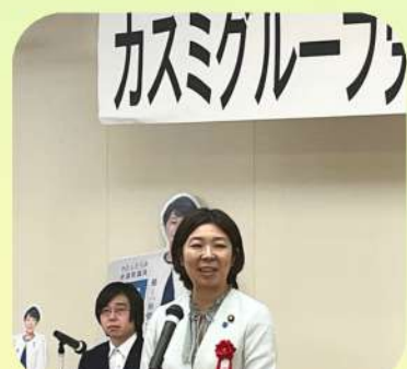
9/27 カスミグループ労連第39回定期大会