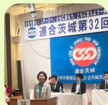
10/30 連合茨城第32回定期大会