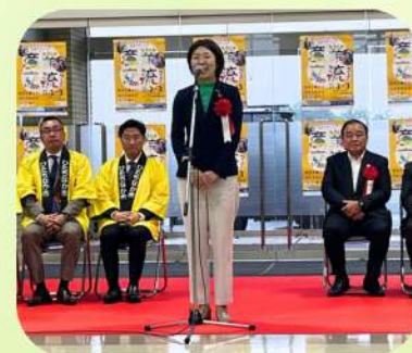
11/2 ひたちなか市産業交流フェア