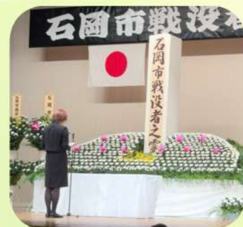
11/8 石岡市戦没者追悼式