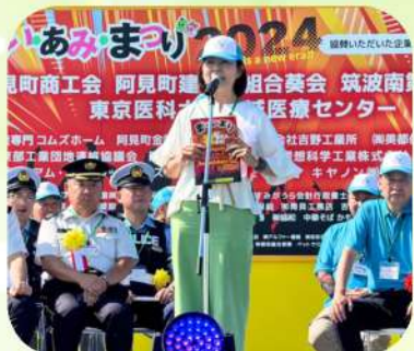
8/3 まい・あみ・まつり