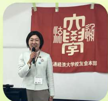
11/3 流通経済大学校友会茨城支部総会