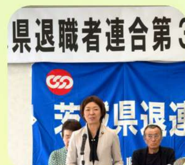
10/28 茨城県退職者連合第33回定期総会