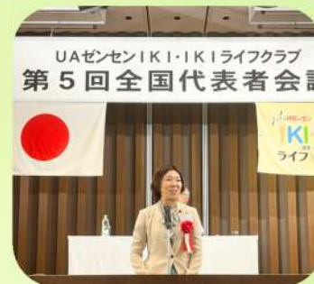
9/17 IKI・IKIライフクラブ第5回全国代表者会議