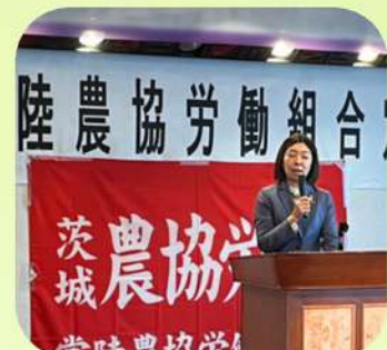
8/31 第10回常陸農協労組定期大会