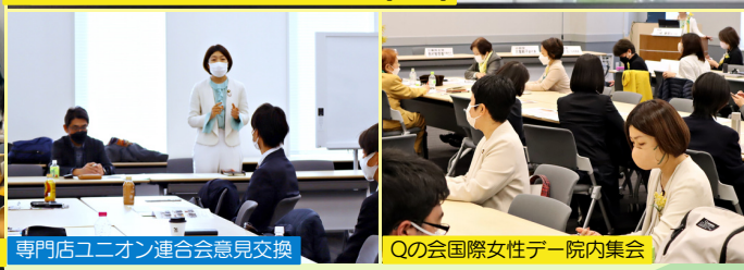
専門店ユニオン連合会意見交換