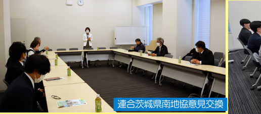
連合茨城県南地協意見交換