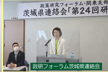
政研フォーラム茨城県連絡会