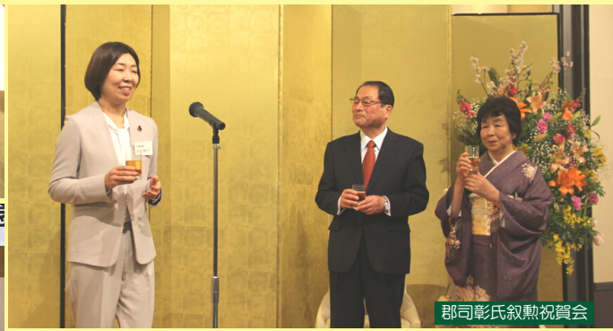
郡司彰氏叙勲祝賀会