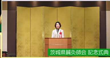
茨城県鍼灸師会 記念式典