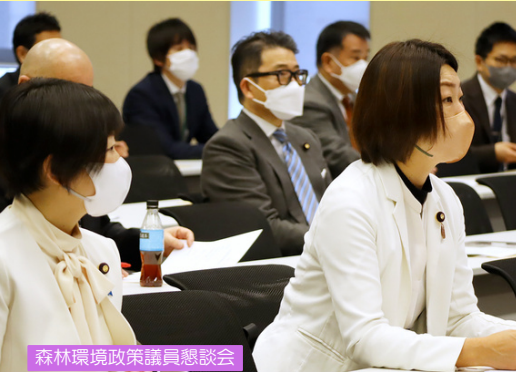
森林環境政策議員懇談会