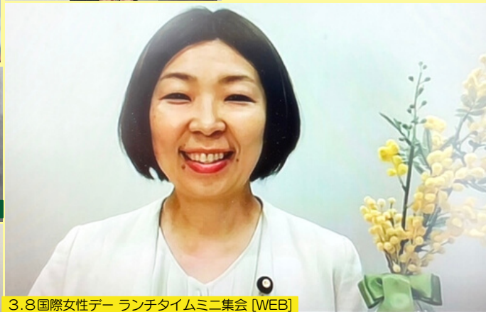
3.8国際女性デー ランチャイムミニ集会 [WEB]