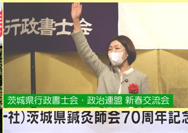
茨城県行政書士会・政治連盟 新春交流会 （社）茨城県鍼灸師会70周年記念