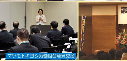
マツモトキヨシ労働組合意見交換