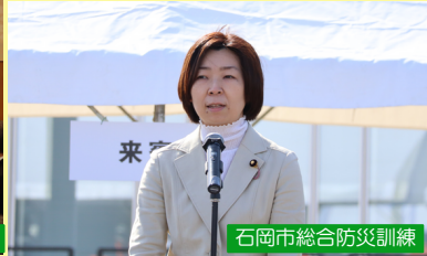
石岡市総合防災訓練