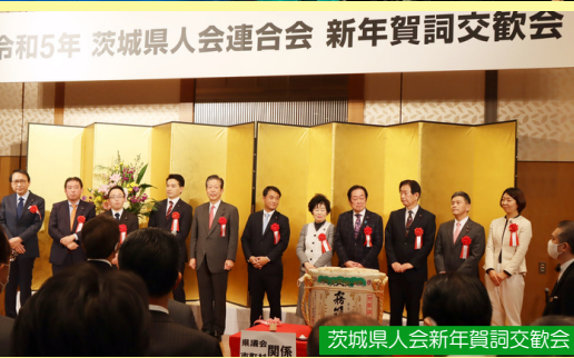
茨城県人会連合会 新年賀詞交歓会