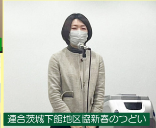
連合茨城下館地区協新春のつどい