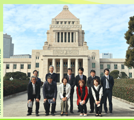
連合茨城県南地協国会見学

堂込事務所までどうぞお気軽 にお問い合わせください！ ご希望の日時(平日)でご相談 ください 団体・個人を問いません