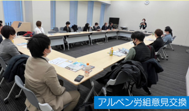
アルペン労組意見交換