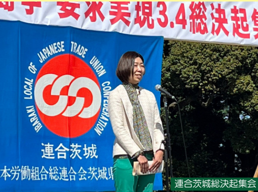
連合茨城総決起集会