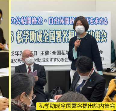
私学助成全国署名提出院内集会